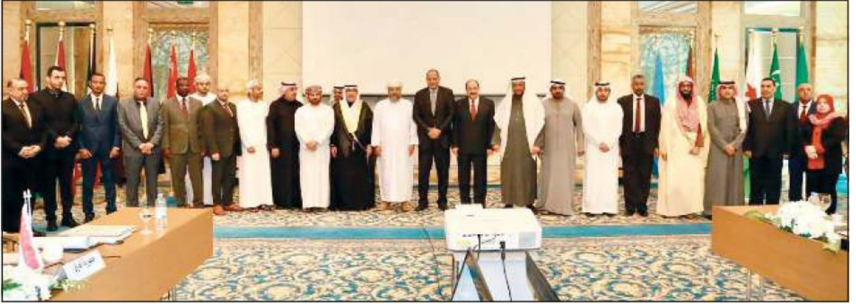
المشاركون في اجتماع لجنة الخبراء

على أسس من العدل والحرية والمساواة وتحقيقاً لمبادئ ديننا الإسلامي الحنيف في المساواة والتسامح بين كل البشر، حيث يأتي هذا القانون استكمالاً للمنظومة التشريعية الاسترشادية العربية.