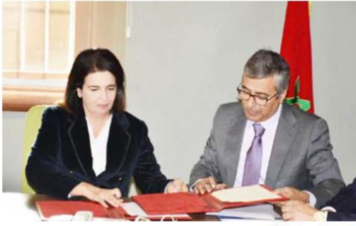
جانب من توقيع مذكرة التفاهم