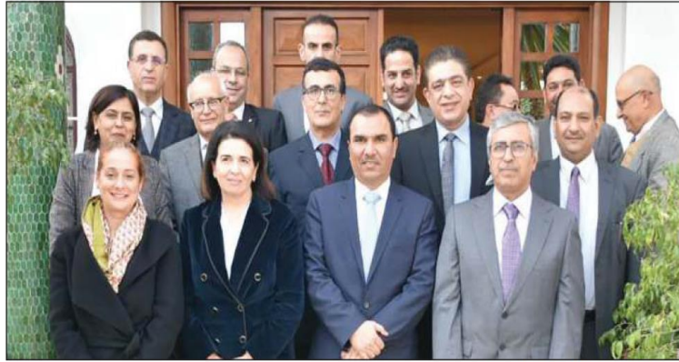
أعضاء اللجنتين الكويتية والمغربية