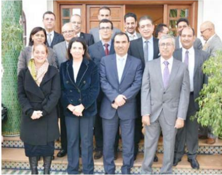
أعضاء اللجنتين الكويتية والمغربية بعد توقيع مذكرة التفاهم