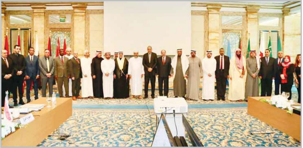
المشاركون في لجنة الخبراء العرب