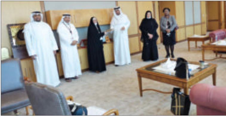
العفاسي مستقبلاً الوفد

تسلم وزير العدل والأوقاف والشؤون الإسلامية الدكتور فهد العفاسي، ملفاً يشمل تفاصيل قضية متضرري النصب العقاري، والذي كان محل اهتمامه، وإعداداً بالبدء في دراسة الموضوع، من أجل وضع الحلول المناسبة.