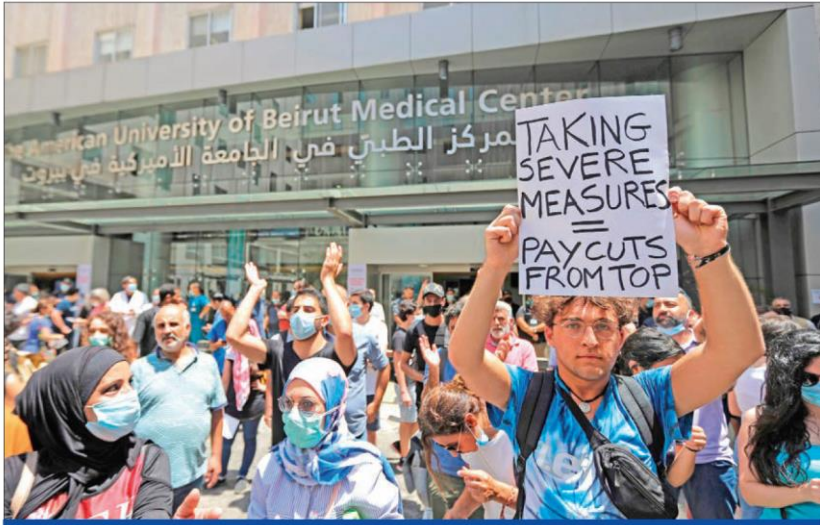
لبنانيون يتظاهرون احتجاجاً على صرف 850 موظفاً من مستشفى الجامعة الأميركية في بيروت أمس

في قرار قضائي هو الأول من نوعه في لبنان يطال أحد أعمدة النظام المالي، أصدر رئيس دائرة التنفيذ في بيروت القاضي فيصل مكي، أمس، قراراً ينص على الحجز الاحتياطي على ممتلكات حاكم مصرف لبنان رياض سلامة. ويقضي القرار بإلقاء الحجز الاحتياطي على عقارات سلامة وعلى موجودات منزله الكائن في منطقة الرابية، مع احتفاظ الحاجزين بشمول الحجز لاحقاً سيارته الخاصة، بعد الاستحصال على شهادات قيدهما من هيئة إدارة الأليات والمركبات، وعلى مخصصاته المالية في مصرف لبنان. إلا أن مصدراً قضائياً كشف لـ «الجريدة»، أمس، أنه «بحسب القانون 2020/156 الصادر في مايو الماضي لا تحرك دعوى الحق العام بحق موظف بدون ادعاء النيابة العامة، وبالتالي القرار المبني على شكوى مباشرة لا أساس قانونياً له».