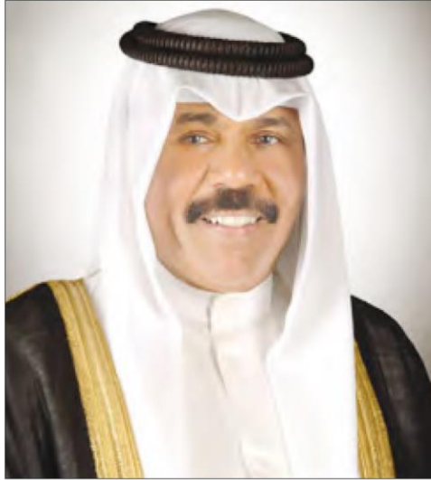
سمو ولي العهد