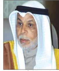
المستشار يوسف المطابوعة

أن نيابة التمييز واصلت عملها حتى خلال فترة التعطيل وانتهت من إعداد مذكراتها في 4000 طعن بنسبة إنجاز عمل 100٪، مشيراً إلى أن المجلس قرر استمرار العمل بجميع المحاكم على النحو المعتاد وبكامل طاقتها خلال شهري يوليو الجاري وأغسطس المقبل، وذلك لتعويض العمل الذي تأخر نتيجة إجازة جائحة «كورونا» وحرصاً على مصلحة المتقاضين وعدم تعطل مصالحهم، مستنداً بالقول إن على من يرغب بأخذ إجازة عليه مراجعة رئيس المحكمة لتقديرها. وأضاف أن المجلس أكد خلال