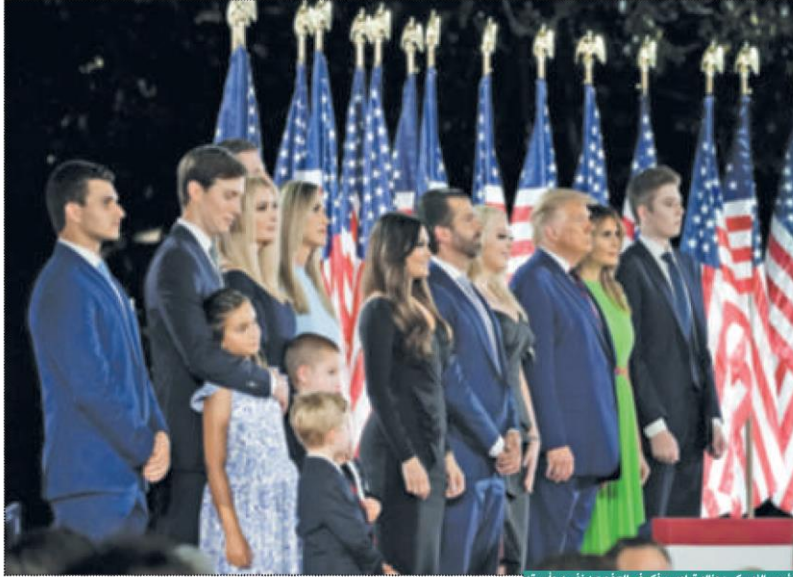
الرئيس الأميركي دونالد ترامب يفكر في العفو عن نفسه وأسرته

ترامب سيصدر «عفواً رئاسياً» عن أبنائه وصهره ومحاميه لإنقاذهم من بايدن