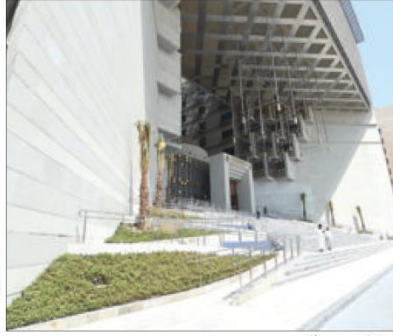
الدخل الرئيسي مهيا للجمع