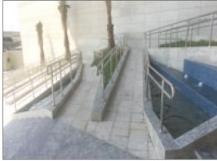
ممرات لذوي الاحتياجات الخاصة

وأوضح بهزاد، أنه بتوجيهات من وزير العدل وزير الدولة لشؤون مجلس الأمة الدكتور فهد العفاسي، وبمتابعة من وكيل الوزارة بالإنابة عمر الشرفاوي، تم تلافي كل الملاحظات، ومنها تقوية الإرسال في جميع أدوار المبنى لخدمة الموظفين والمراجعين، بالتعاون مع شركات الاتصالات الثلاث، كما تم