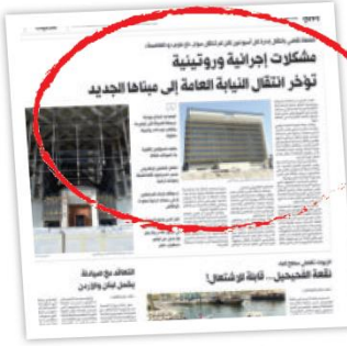
خبر «الراي» يوم الأربعاء الماضي