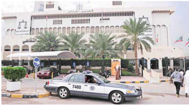
حضور أميني في محيط قصر العدل الأرشيفية

لا تخشى فراهم، إلا أن القاضي رفض طلبات إخلاء السبيل. من ناحية أخرى، أصرت النيابة العامة باستمرار حجز 3 متهمين بالتهمة ذاتها، إضافة إلى متهمين جديدين في قضية «عتيج المسيان» إلى الغد لاستكمال التحقيق.