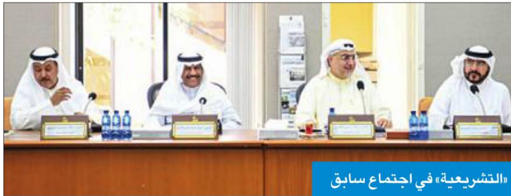
«التشريعية» في اجتماع سابق

وفي البند الثالث تناقش اللجنة مشروع قانون بتعديل بعض أحكام المرسوم رقم 23 لسنة 1990 بشأن قانون تنظيم القضاء، إضافة إلى مجموعة من الاقتراحات بقوانين.