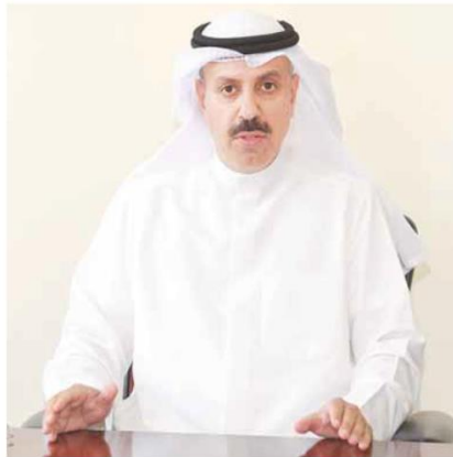
المستشار صلاح الجري متحدثاً لـ القبس

كشف رئيس الإدارة العامة للتنفيذ المستشار صلاح الجري عن أن نسبة المقترضين الكويتيين الصادرة بحقهم أوامر ضبط وإحظار لا تتجاوز 3% من إجمالي المشمولين بالضبط والإحظار. وقال المستشار الجري في أول لقاء صحافي مع القبس إن عدد المدنين الذين صدرت بحقهم أوامر «ضبط وإحظار» خلال عام 2018، بلغ 101 ألف و450 شخصا. وأشار إلى أن عدد المدنين الذين بقيت أوامر الضبط سارية في حقهم بلغ نحو 35 ألفا، منها بأن الكويتيين المدنين لشركات الاتصالات يفوقون عدد المدنين للبنوك، حيث بلغوا 2920 مواطناً.