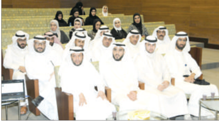
الشرقاوي والضامن يتقدمان الحضور في الندوة

أكد وكيل وزارة العدل المساعد لشؤون الأسرة والتحكيم عمر الشرفاوي أن الوفرة المادية لدى البنت الكويتية واستغنائها عن الرجل مادياً، أحد عوامل ازدياد معدلات الطلاق في الكويت، مشيراً لـ «الراي» إلى أن «قراءة معدلات الطلاق غير دقيقة حيث لا تتجاوز نسبته 2 في المئة من أصل 230 ألف حالة زواج وهو معدل طبيعي»، داعياً إلى ضرورة تدريس مادة الحياة الزوجية في المرحلة الثانوية والجامعة لزيادة الوعي لدى الشباب في أهمية الزواج وكيفية إدارة الأسرة واحكام الطلاق ومشروعيته وتفادي اسبابه.