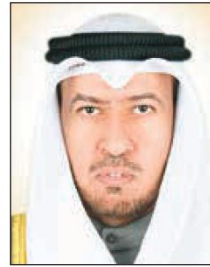
المستشار د.فهد العفاسي