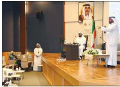
جانب من اجتماع عمر الشرفاوي مع قياديين «العدل»

معاملاتهم بشكل مميز عبر منافذ متعددة وآمنة تضمن الخصوصية والسرية. وفي هذا الإطار، اجتمع وكيل وزارة العدل عمر الشرفاوي مع قياديين من الوزارة ومديري الإدارات والمختصين المعنيين لإعطاء تعليماته للعمل على سرعة حل المشكلات ومواجهة أي صعوبات تعترض هذا المشروع الوطني وخاصة الاهتمام بدقة البيانات المدخلة على الأنظمة الآلية وسرعة إدخالها حتى تكون البيانات الموجودة على الأنظمة انعكاساً حقيقياً