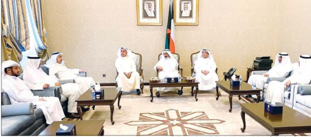
المستشار أحمد العجيل وأعضاء المجلس الأعلى للقضاء خلال اللقاء مع الوزير عبدالله الرومي