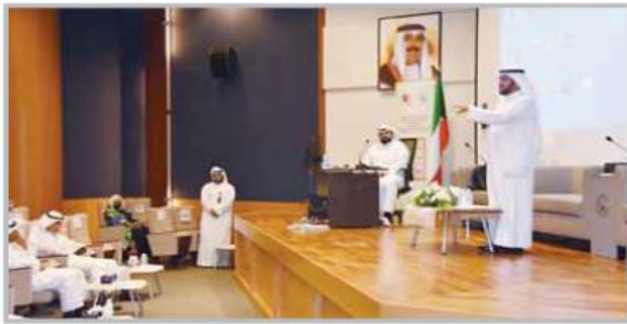
■ وكيل وزارة العدل عمر الشراوي أثناء الاجتماع مع قياديي الوزارة

والأنظمة الالية وسرعة إدخالها حتى تكون البيانات الموجودة على الأنظمة انعكاساً حقيقياً لواقع الملفات مع ضمان أن تكون الصور الإلكترونية للمستندات واضحة ومكتملة.