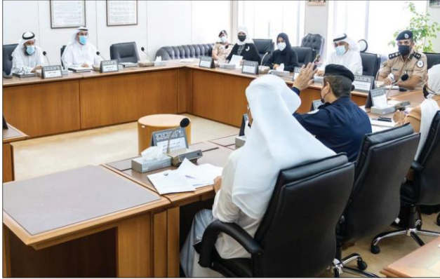
جانب من اجتماع لجنة شؤون المرأة والأسرة والطفول الأس

خلافات اسرية تم تداولها في 2020 هناك امرأة ادعت ان هناك عنفا مورس ضدها وهناك 116 رجلا ادعى وجود شكل من أشكال العنف. وبين انه من جهة أخرى لا بد من كسر دائرة العنف التي تمارس على الطفل الذي بدوره عندما يكبر يمارسها على الآخرين. ومن بيننا العنف اللفظي والتفخر في المدارس وعلى الوسائل الكترونية والأفلام وغيرها. وأكد الشاهين ان تلك الظواهر مرفوضة في ديننا الإسلامي وفي عاداتنا وتقاليدنا ومجتمعنا المسلم والمسالم، وهو ما يستلزم معالجتها بالشكل الملائم حفاظا على الأسرة الكويتية من جهة أخرى، قال الشاهين إن اللجنة أرسلت كتابا إلى اللجنة التشريعية للاستعجال في تحويل الاقتراحات بقوانين بشأن إلغاء المادة 135 وتشديد عقوبة اقتحام المنازل لارتكاب جرائم جنسية والعنف الأسري هو المفهوم الأكبر، مشيراً إلى أنه من أصل 4339 قضية طلاق أو