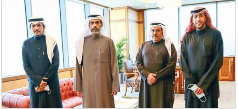
د.نواف الياسين خلال استقباله رئيس وأعضاء جمعية الشفافية

وزير العدل: عدة قوانين متعلقة بمكافحة الفساد تم الانتهاء منها وسيتم رفعها إلى مجلس الأمة قريباً وفي مقدمتها مشروع قانون تعارض المصالح