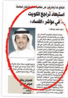
خير الراي، النشر الأربعاء الماضي

ولفتت إلى أن «منظمة الشفافية لا تقدم تحليلاً خاصاً لنتيجة دولة الكويت، وتترك التحليل للجهات المحلية والحكومية المختصة، ومؤسسات المجتمع المدني وفق ما ينشأ من نتائج في المصادر التي تقيس أداء الدولة، ووفق المعطيات المحلية لكل دولة حسب أداؤها في مجالات القياس وأوجه الفساد التي يربصها المؤشر».