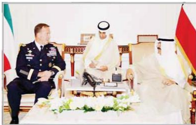
■ ... ومستقبلاً قائد القيادة المركزية الوسطى الأميركية الجنرال مايكل كوربلا

■ الكويت قيادة وشعباً تعزز بعزم العلاقات الكويتية - التركية الممتدة