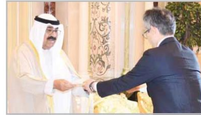
■ ... ويتسلم أوراق اعتماد سفير اليابان