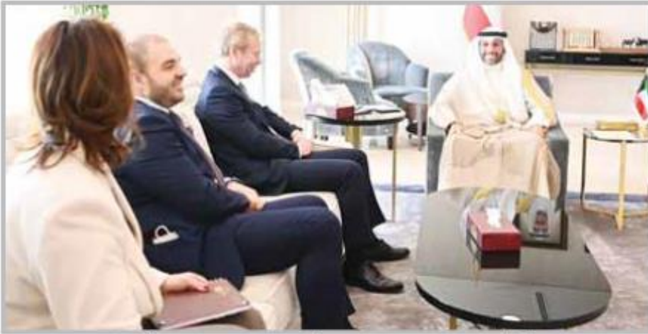
رئيس مجلس الأمة مرزوق الغانم مستقبلاً ممثلاً أوروبا للسلام في الشرق الأوسط سفين كويمانس

■ استقبل رئيس مجلس الأمة مرزوق الغانم في مكتبه امس، رئيس المجلس الأعلى للقضاء رئيس محكمة التمييز المستشار أحمد العجيل يرافقه رئيس محكمة التمييز في جمهورية تركيا محمد أكارجا والوفد المرافق له وذلك بمناسبة زيارته للبلاد.