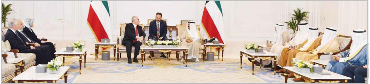
■ سمو نائب الأمير ولي العهد الشيخ مشعل أحمد مستقبلاً رئيس محكمة التمييز التركية محمد أكرجا والوفد المرافق

سموه استقبل محمد وقائد القيادة المركزية الأميركية وتسلم أوراق اعتماد سفراء اليابان والمغرب ومالي