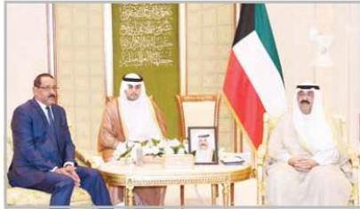
■ ... ولدى تسلمه أوراق اعتماد سفير جمهورية مالي علي ولد أحمد

استقبل سمو نائب الأمير ولي العهد الشيخ مشعل الأمين بقصر بيان أمير، رئيس المجلس الأعلى للقضاء ورئيس محكمة التمييز المستشار أحمد العجيل ورئيس محكمة التمييز بالجمهورية التركية الصديقة محمد أكرجا والوفد المرافق وذلك بمناسبة زيارته الرسمية للبلاد. هذا وقد تلقى سموه تحيات سمو أمير البلاد الشيخ نواف الأحمد إلى الوفد الزائر مشيراً إلى اعتزاز دولة الكويت بقيادة وشعباً لعزم العلاقات الكويتية لتركيا الممتدة. وقد حمل سمو نائب الأمير ولي العهد تحياته لأخيه الرئيس رجب طيب أردوغان رئيس جمهورية تركيا الصديقة والشعب التركي الصديق. وقد أكد خلال اللقاء على ثقته الكاملة بالقضاء ومؤسساته مع التأكيد على استقلالته ونزاهته ودوره المسؤول في حماية حقوق المواطنين والمقيمين على حد سواء. كما أعرب سموه عن تطلعه إلى مزيد من الإجراءات لحماية المستثمرين الكويتيين في تركيا من النصب