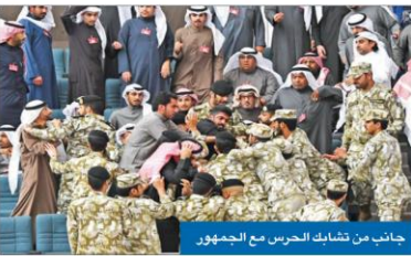
جانب من تشابك الحرس مع الجمهور

للاستبدال والنسب من تاريخ العمل بهذا القانون، إضافة إلى السماح بإعادة الحق في الاستبدال كاملاً للمستبدلين من أصحاب المعاشات التقاعدية بعد سداد أصل القيمة الاستبدالية.