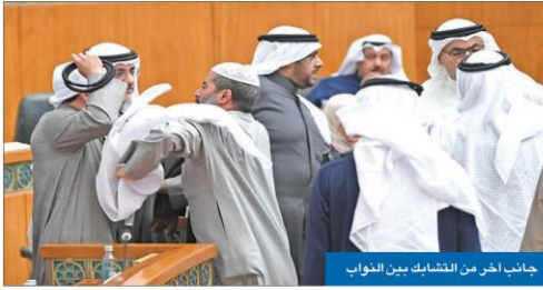
جانب آخر من التشابك بين النواب

رئيس المجلس: مسرحية مُخطط لها لتكفير الشعب بالديمقراطية