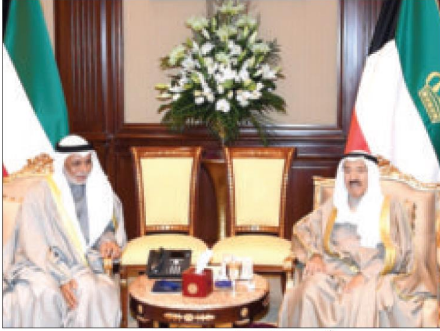
صاحب السمو مستقبلاً المستشار المطاوعة

كونا - استقبل صاحب السمو أمير البلاد الشيخ صباح الأحمد، في قصر بيان صباح أمس، سمو ولي العهد الشيخ نواف الأحمد. كما استقبل سموه على التوالي: رئيس مجلس الأمة مرزوق الغانم، وسمو الشيخ جابر المبارك، وسمو رئيس مجلس الوزراء الشيخ صباح الخالد، ورئيس المجلس الأعلى للقضاء ومحكمتي التمييز والدستورية المستشار يوسف المطاوعة.