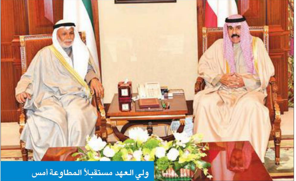
ولي العهد مستقبلاً المطاوعة أمس

واستقبل سموه، رئيس المجلس الأعلى للقضاء، رئيس محكمة التمييز، رئيس المحكمة الدستورية المستشار يوسف المطاوعة، ونائب رئيس مجلس الوزراء وزير الدولة لشؤون مجلس الوزراء وزير الداخلية أنس الصالح.