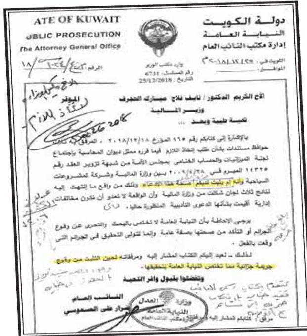
صورة ضوئية من كتاب النيابة إلى المالية

3 - إحالة جريمة بلا أسماء لمتهمين (وهو ما ينتهي إلى حفظ البلاغ).