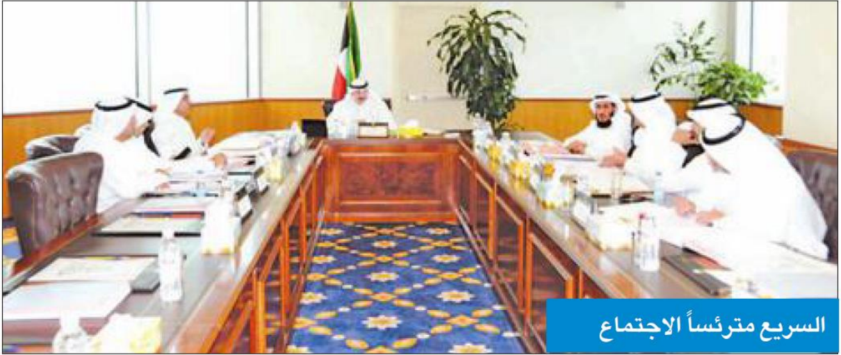
السريع مترئساً الاجتماع

وفق اختصاص كل جهة من الجهات المعنية بتنفيذها. وبحث اللجنة التقارير الدولية فيما يخص حالة الاتجار بالأشخاص وتوحيد الجهود الوطنية بصددها، كما ناقشت دليل الإحالة الوطنية المقدم من ممثل وزارة الخارجية وتقرر إحالته إلى الجهات المختصة للرد عليه وإبداء مرئياتها وملاحظاتها بشأنه، ومناقشته في الاجتماع القادم للجنة، تمهيداً لإقراره والعمل به.